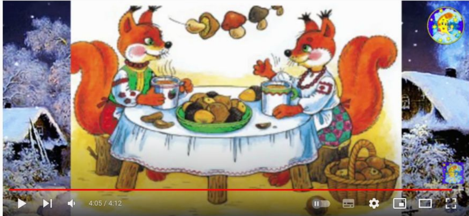
Дві білочки 😊 аудіоказка з малюнками

https://www.youtube.com/watch?v=c9ds1XcR4g0&ab_channel=%D0%96%D0%B8%D1%82%D1%82%D1%8F-kids%21