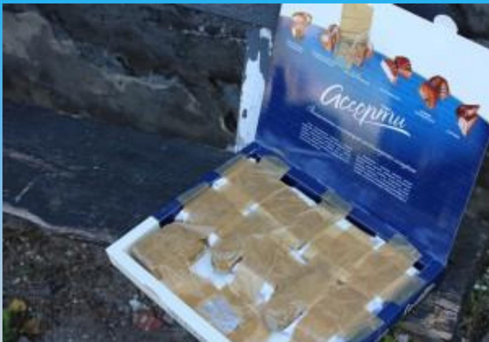
Вибуховий пристрій замаскований під коробку цукерок.