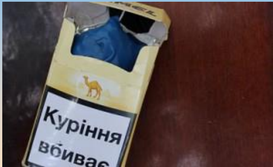
Вибуховий пристрій в цигарках.