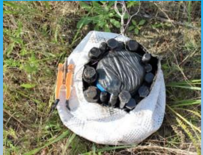
Вибуховий пристрій у футбольному м'ячі.