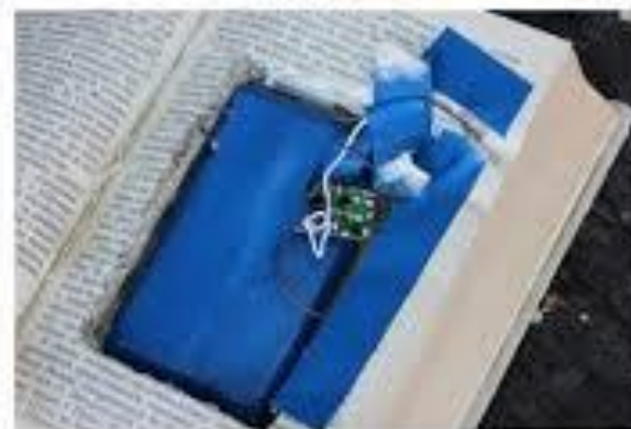
Вибуховий пристрій замаскований під книжку