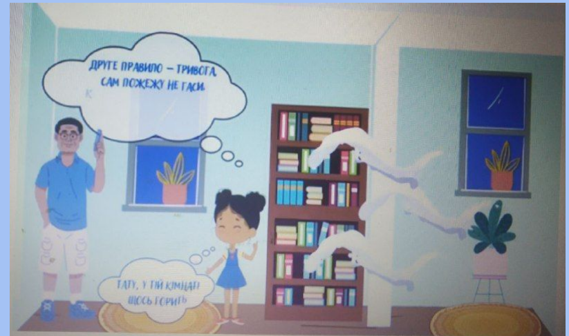
Мультфільм "Що робити під час пожежі?"