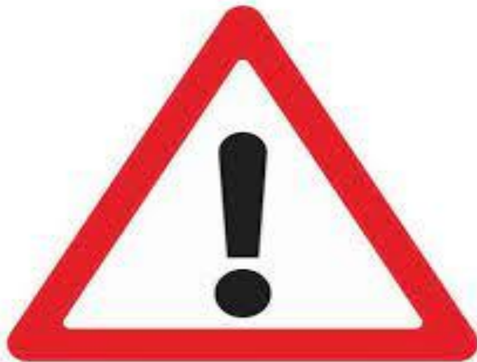
ІНША НЕБЕЗПЕКА (АВАРІЙНО- НЕБЕЗПЕЧНА ДІЛЯНКА)