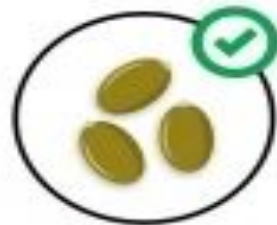
насіння гарбуза, дині, кавуна (сире)