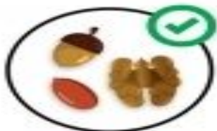
горішки та родзинки (сирі)