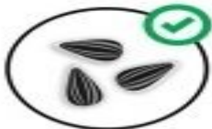
соняшникове насіння (сире)