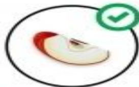
яблука і груші (шматочки)